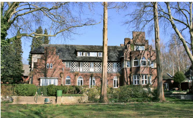
Das Peter-Faber-Haus in Berlin-Kladow